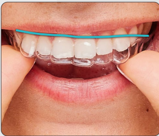
ClearCorrect design Hoog en recht

Ons unieke, bewezen design zorgt ervoor dat de arts meer controle heeft over hoe je tanden bewegen tijdens de behandeling 4 , wat er aan bijdraagt om het doel te bereiken.